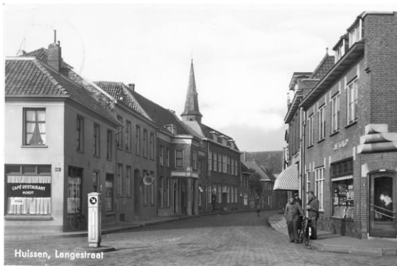
Markt met Café Hoedt